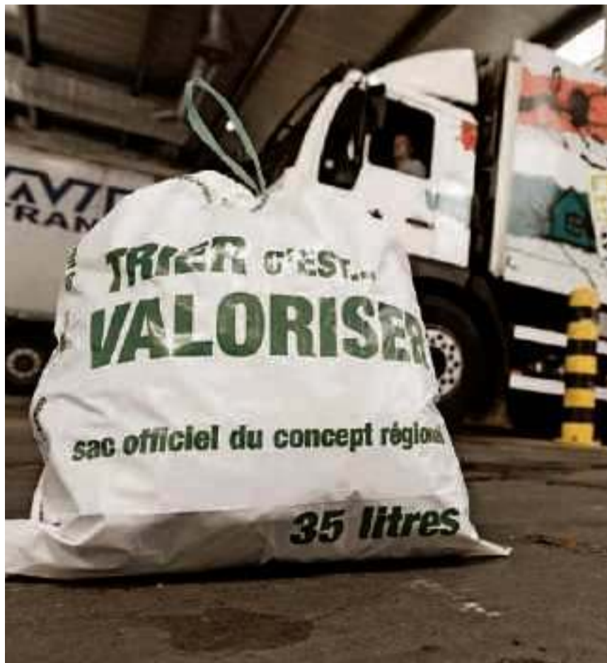
A Losanna e in molti comuni vodesi la tassa sul sacco è già una realtà. (Keystone)

A Losanna, a titolo di confronto, dopo un anno dall'introduzione della tassa, i rifiuti sono diminuiti del 40%. Secondo un'indagine dell'Ufficio federale dell'ambiente, sui materiali riciclabili che finiscono nella spazzatura, in Svizzera c'è un buon potenziale di riciclaggio: troppa carta, vetro e PET finiscono ancora nei sacchi dei rifiuti.